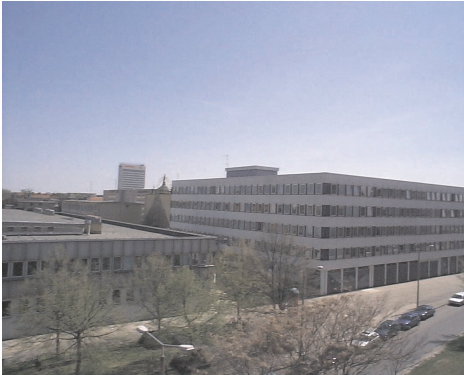
Hauptstandort des Amtes für Statistik Berlin-Brandenburg in Potsdam, Dortustraße 46