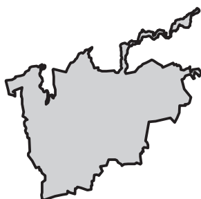
Brandenburg an der Havel

Historisches Gemeindeverzeichnis des Landes Brandenburg 1875 bis 2005